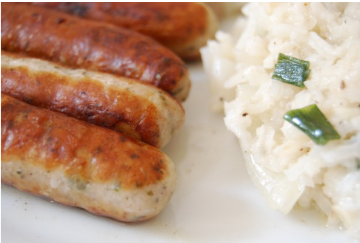
Wurst und Reis

Heute gibt es nichts weltbewegendes. Vom gestrigen Lauchzwiebel-Reis war noch übrig, er sieht zwar nicht mehr ganz frisch aus, aber schmeckt noch. Die Packung Nürnberger Rostbratwürste lag auch schon eine Weile im Tiefkühlschrank, daraus konnte man auch einige zur Zubereitung verwenden. Der Reis wird einfach mit etwas Wasser wieder erhitzt, die