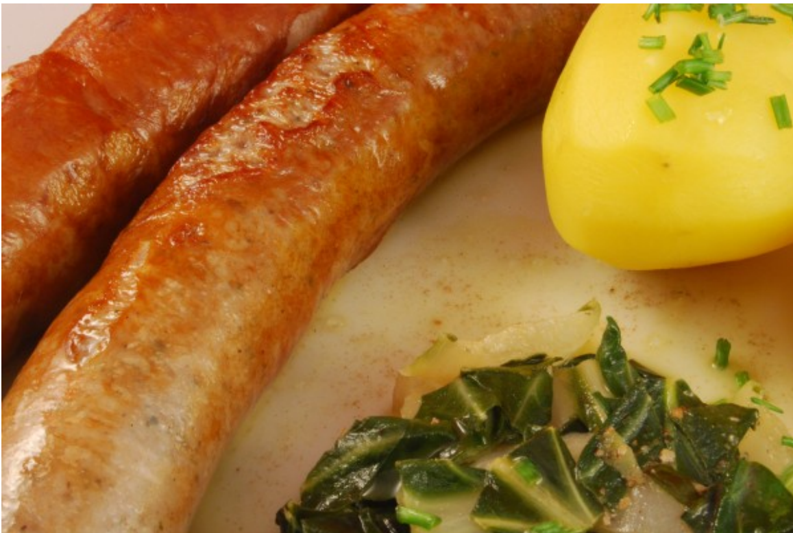
Wurst, Mangold, Kartoffel