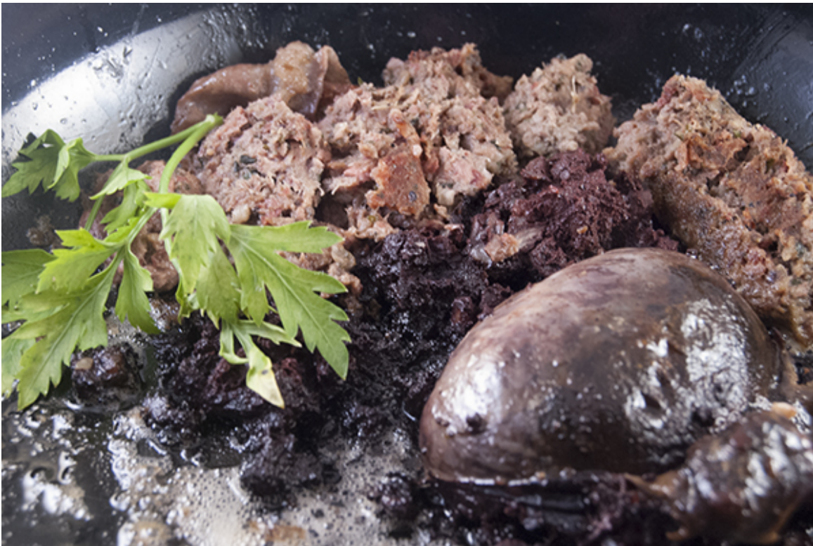
Gebratene Leber- und Blutwurst in der Pfanne

Dies ist im Prinzip eine reduzierte Schlachtplatte. Eine Schlachtplatte besteht aus Kesselfleisch – Kesselfleisch wird traditionell unmittelbar nach der Schlachtung in einem Kessel zubereitet – wie z.B. gekochtem Bauchfleisch, dann gekochter frischer Leber- und Blutwurst, Brat- und Mettwurst und Sauerkraut und Senf. Dieses Gericht beinhaltet jedoch nur gebratene frische Leber- und Blutwurst. Meine Mutter hat sie mir und meinem Bruder früher ab und zu zubereitet. Die Würste werden einfach in Butter angebraten, angestochen, damit der frische Wursthalt herausquillt und anbrät. Würzen ist natürlich nicht notwendig, versteht sich. Das Gericht ist zwar verständlicherweise sehr fett, aber wenn man das nur einmal im Monat zubereitet, ist das durchaus akzeptabel. Und ... es schmeckt lecker!