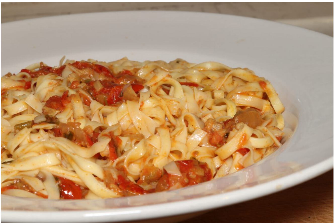
Sauce mit Cherrydatteltomaten und Sahne Für 2 Personen:

Es kommen Cherrydatteltomaten hinein, Zwiebel, Knoblauch und für etwas Schärfe Peperoni. Dann eine große Portion gemahlenes Paprikapulver. Und die Flüssigkeit bilden sowohl der Saft der Tomaten als auch etwas Rinderfond und Sahne. Wenn Sie es vegetarisch möchten, verwenden Sie einfach Gemüsebrühe anstelle des Rinderfonds.