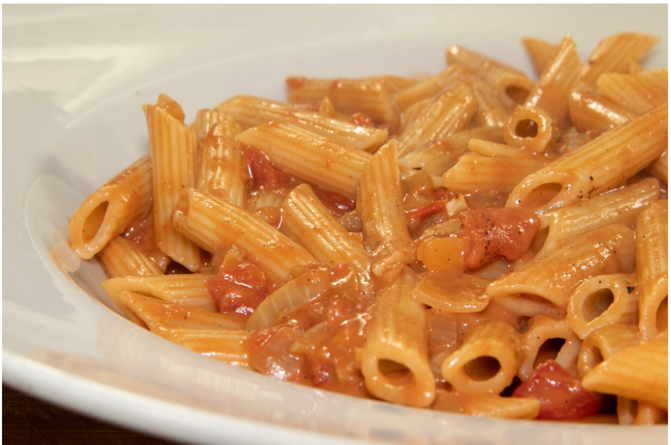
Pasta und Soße

Zubereitungszeit: Vorbereitungszeit 10 Min. | Garzeit 12 Min.