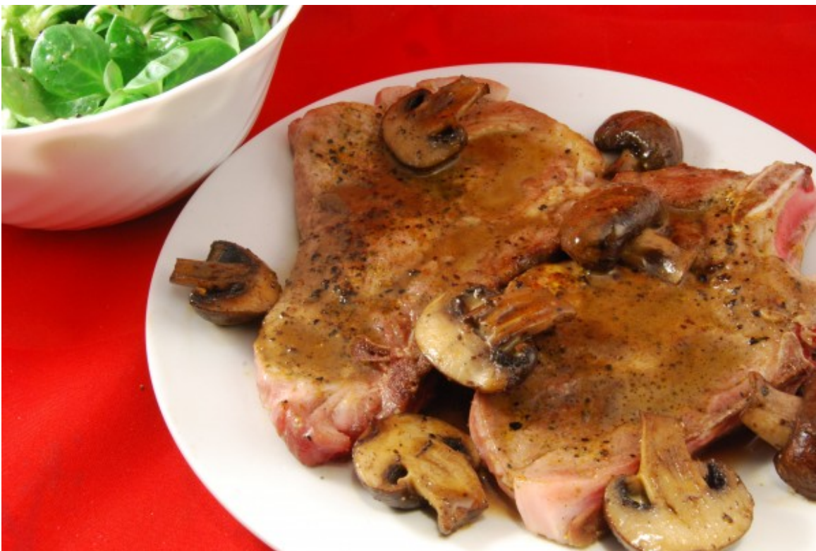
Steak, Champignons, Salat

Dieses Mal etwas einfaches, zwei Nackensteaks, für das Entrecôte oder ein anderes edleres Steak reichte es nicht mehr. Dazu einige frische Champignons in einem braunen, stark reduzierten Sößchen. Und frischer Feldsalat.