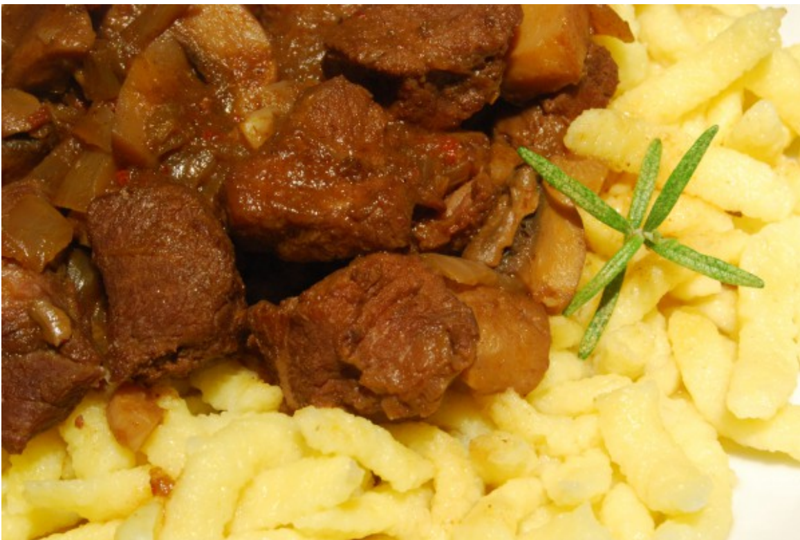
Fleisch mit Pasta

So richtig passt das nicht zusammen, denn das Gulasch wird in einer Marinade aus asiatischen Saucen mariniert. Und dazu dann schwäbische Eierspätzle. □ Aber man kann auch einfach sagen: Fleisch mit Pasta. Dann passt es besser. Und wie immer das Gulasch mit viel Zwiebeln und einigen Champignons zubereitet und sehr lange köcheln lassen, um einen runden Geschmack zu bekommen.