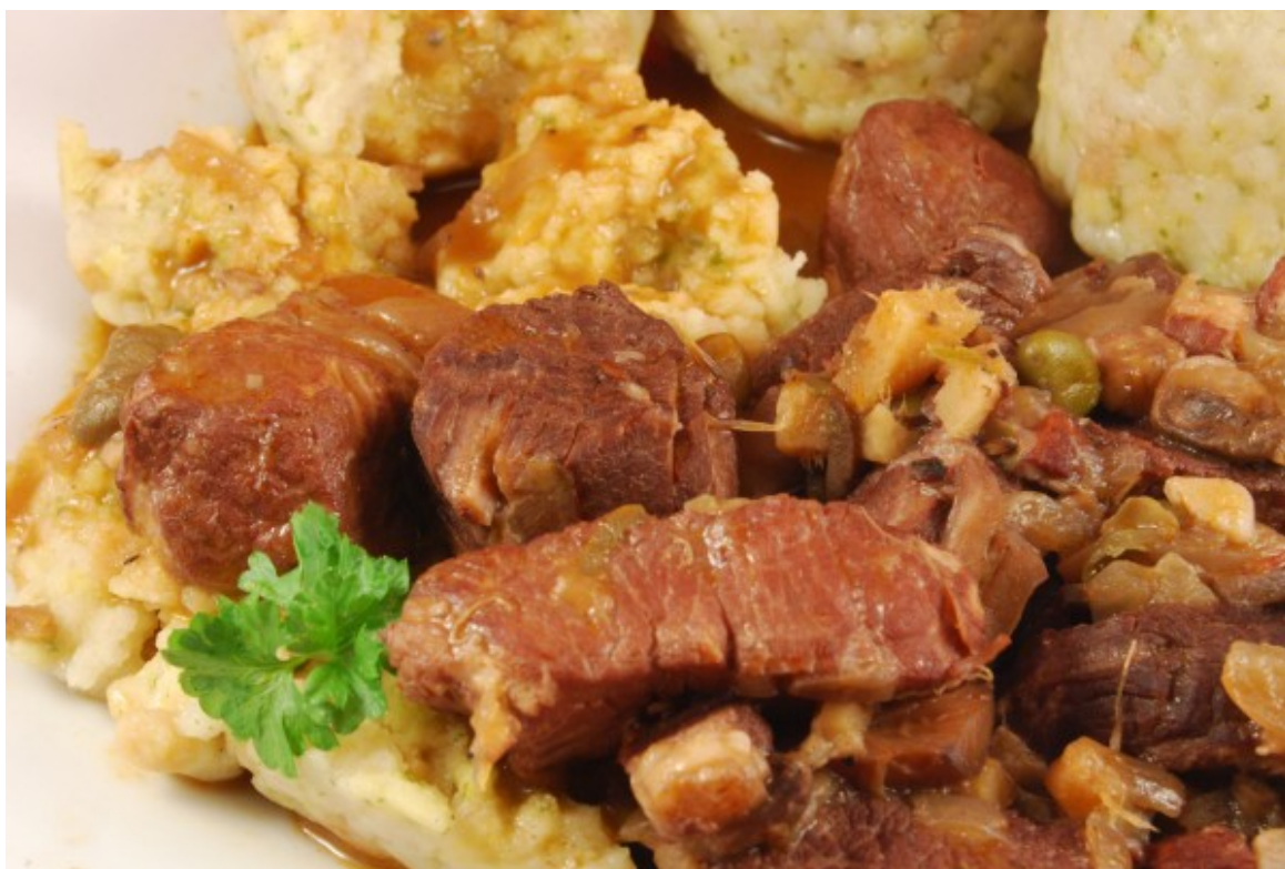
Gulasch, Knödel, Sauce

Klassisch kann man dieses Gulasch sicherlich nicht nennen. Es kommen zwar sehr viele Zwiebeln hinein, was ein gutes Gulasch ausmacht. Aber nicht unbedingt Speck und Champignons, die ich noch vorrätig hatte und verbrauchen wollte. Rotwein, Fond und etwas Tomatenmark geben der Sauce Geschmack. Und auch Kapern und Gewürze wie Lorbeerblätter, Kreuzkümmel und Paprikapulver geben ihren Anteil dazu. Nicht fehlen darf jeweils eine Prise Kümmel und Zucker. Zumindest die Beilage ist klassisch – Klöße. Aber diese faulheitsbedingt nur aus der Packung. (duckundwech) □