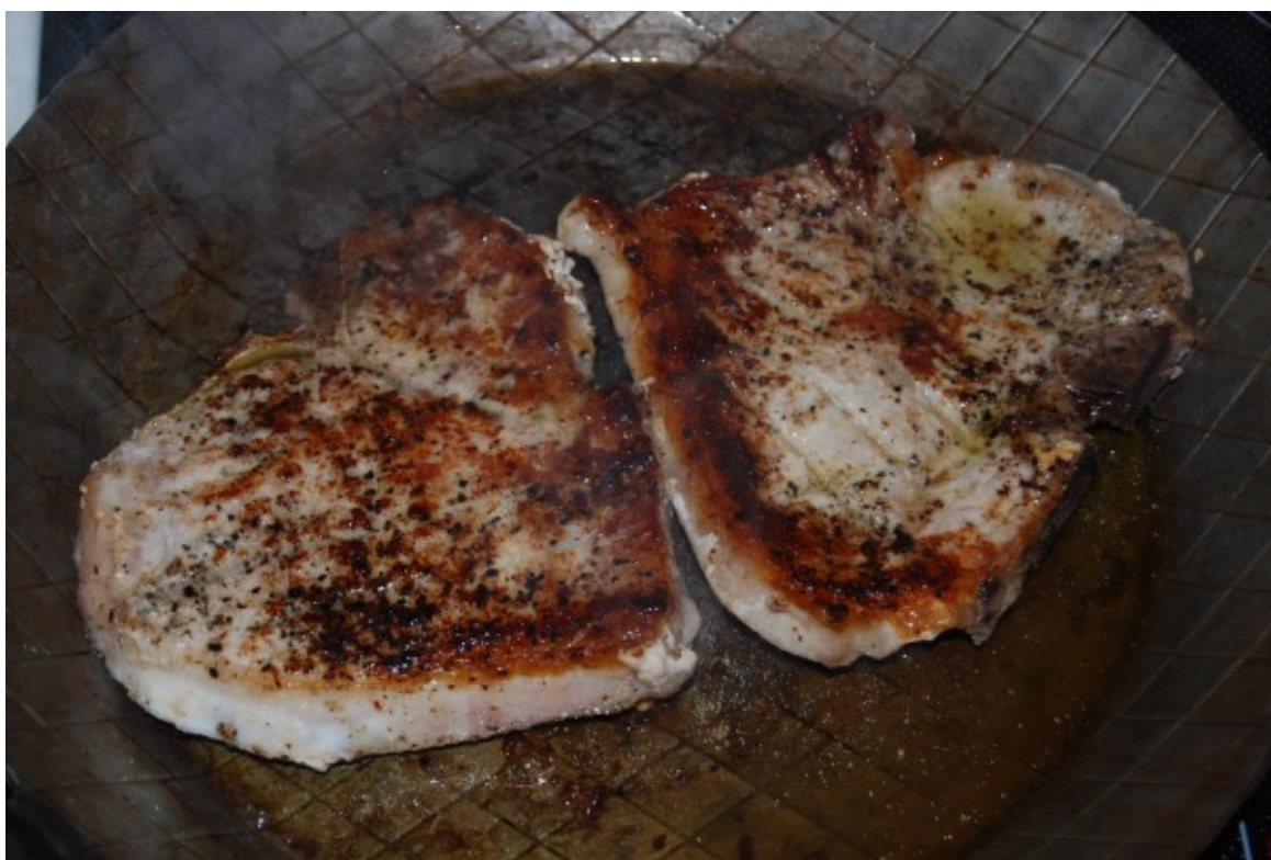
Filetkoteletts angebraten in der Pfanne

Wieder etwas gelernt. Mein Schlachter erklärte mir, dass es bei Schweinekoteletts, die ich normalerweise nur sehr selten kaufe und diesmal nur aus Preisgründen kaufte, solche ohne und mit Filetteil gibt. Erstere sind normalerweise diejenigen, die man landläufig unter „Koteletts“ versteht, letztere sind schmackhafter und etwas teurer.