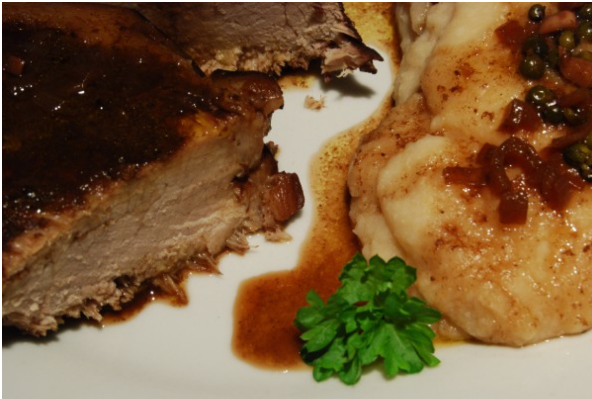
Braten, Pürree und Sauce

Die Kruste des Bratens habe ich einfach übergangen. Der Braten hat nur 500 g für eine Person und ist etwa daumendick. Die Kruste auf einer der schmalen Seiten aufzuknuspern, wäre schwierig geworden, der Braten bleibt so hochkant sicher nicht stabil stehen.