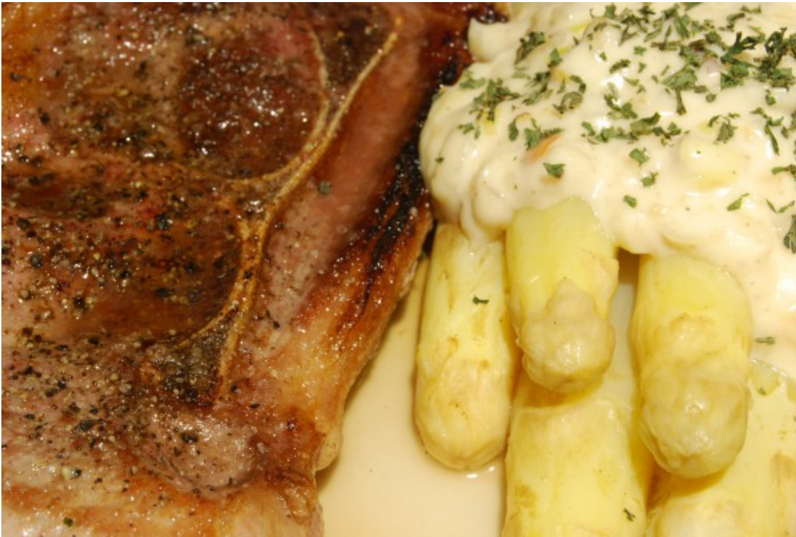
Steak, Spargel, Käsesauce

Das Holzfällersteak – Entrécôte des armen Mannes – sollte es eigentlich für Papa am Vatertag geben. Aufgrund verschiedener Umstände, darunter auch einige abendliche Spielfilme, wurde es spät und dann war der Feiertag vorbei. Das Steak wird in hochofentem Öl auf jeder Seite 2–3 Minuten scharf gebraten, der danach auf dem Teller austretende Fleischsaft zeigt, dass es nicht Trockengebieten wurde. Gewürzt wird sparsam nach dem Braten nur mit Salz und schwarzem Pfeffer. Dazu gab es ein Pfund frischer Spargel. Für die Sauce hatte ich – mangels Butter und Milch für eine Béchamelsauce oder sogar nur eine einfach Mehlschwitze – drei Alternativen. Einmal hatte ich geriebenen Emmentaler, der mit 45 % Fettanteil sicher in Weißwein zu einer Käsesauce geschmolzen wäre. Zum anderen einen dänischen Schnittkäse, Caverna, dessen Schmelzfähigkeit mit 15,5 % Fettanteil jedoch fraglich war. Und schließlich eine Frischkäsezubereitung mit Ananas, Papaya