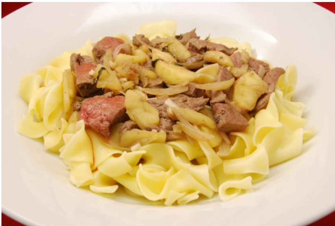
Leber-Zwiebel-Apfel mit Pasta

Die Kombination Leber–Zwiebel–Apfel passt eigentlich immer. Diesmal jedoch gare ich halbierte Apfelspalten direkt mit der Leber mit. Wichtig ist, die Leberstreifen wirklich nur einige Minuten zu garen, so bleiben sie innen noch zart und rosé. Gerne brate ich als erstes Sardellenfilets im Fett an, der Geschmack passt auch gut zur Leber. Und trockener Weißwein bringt etwas Sauce. Als Kraut kommt frischer Salbei hinzu, der auch gut zur Leber passt. Und dazu einfach Bandnudeln.