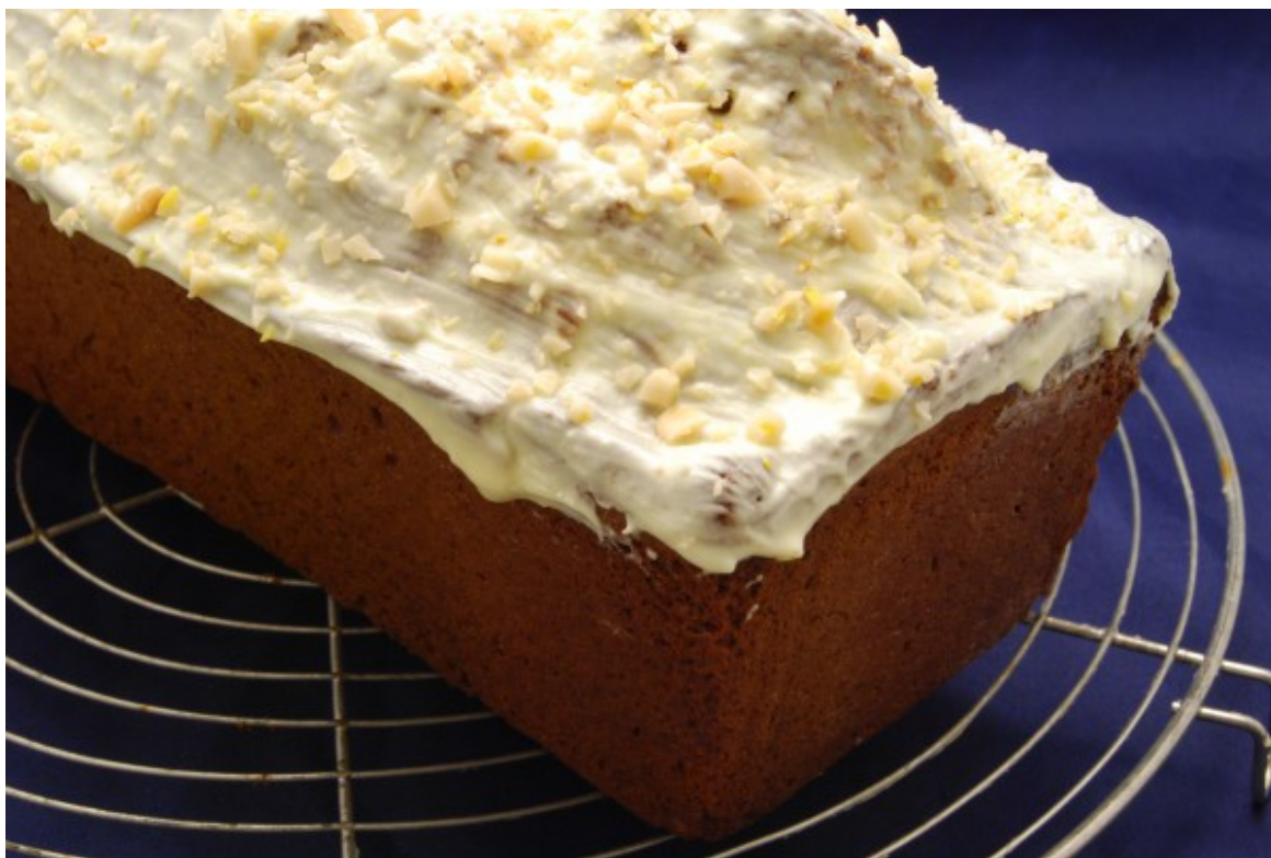
Der weiße Kuchen

Kurz vor Ende der Backzeit Schokolade in grobe Stücke zerkleinern und ebenfalls im Wasserbad schmelzen. Pinienkerne grob zerhacken.