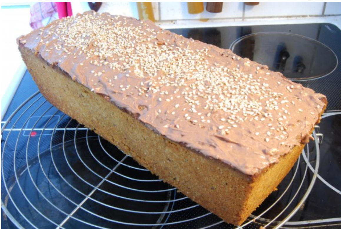
Ansprechender Kuchen, in Kastenform

Rührteig in die Backform geben und mit dem Backlöffel gut verstreichen. Backform für 60 Minuten auf mittlerer Ebene in den Backofen geben.