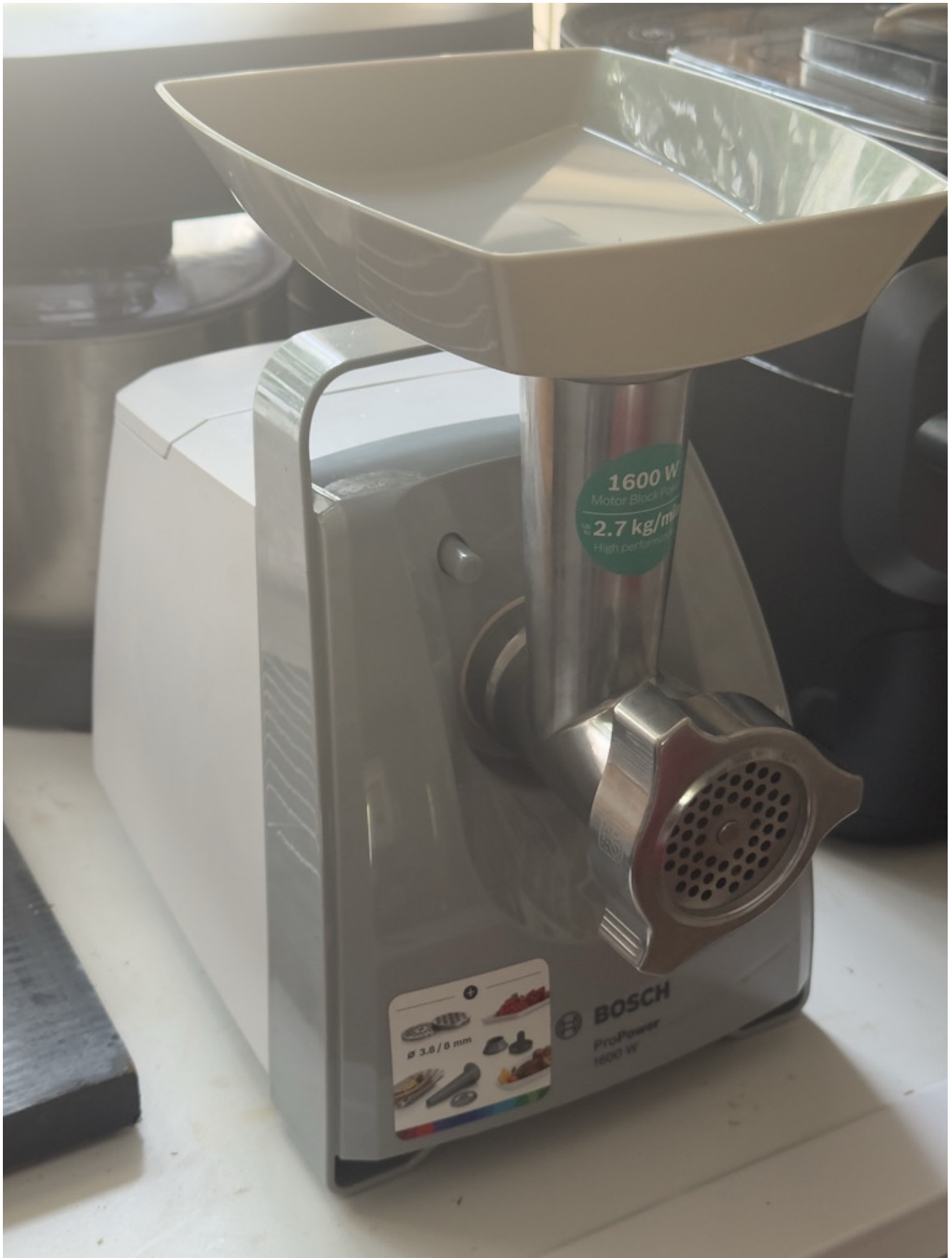
Der neue Fleischwolf