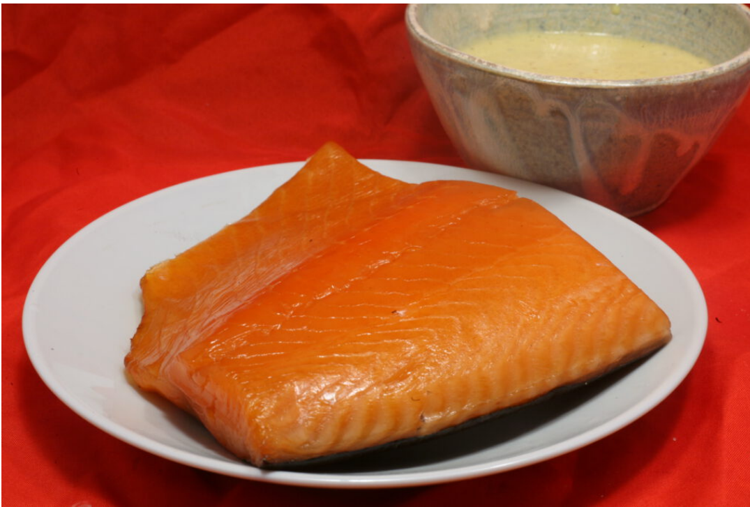
Lachs von der Ostsee

Mein Bruder und seine Freundin verbrachten einen diesjährigen, 1 \frac{1}{2} -wöchigen Urlaub bei Lübeck an der Ostsee. Und bei der Rückfahrt nach Weinheim/Odenwald fragte ich sie, ob sie nicht bei mir zum Kaffeetrinken vorbeikommen wollten, meine Wohnung sei von der Autobahn-Abfahrt nur 5 Minuten in Hamburg entfernt.