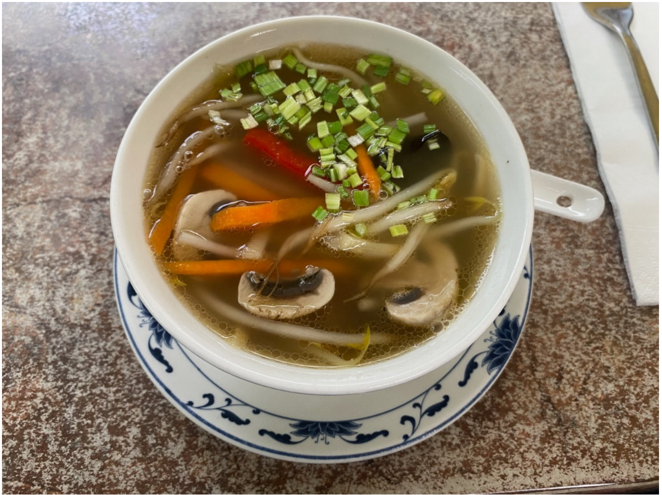
Mongolische Gemüsesuppe Und als Hauptspeise: