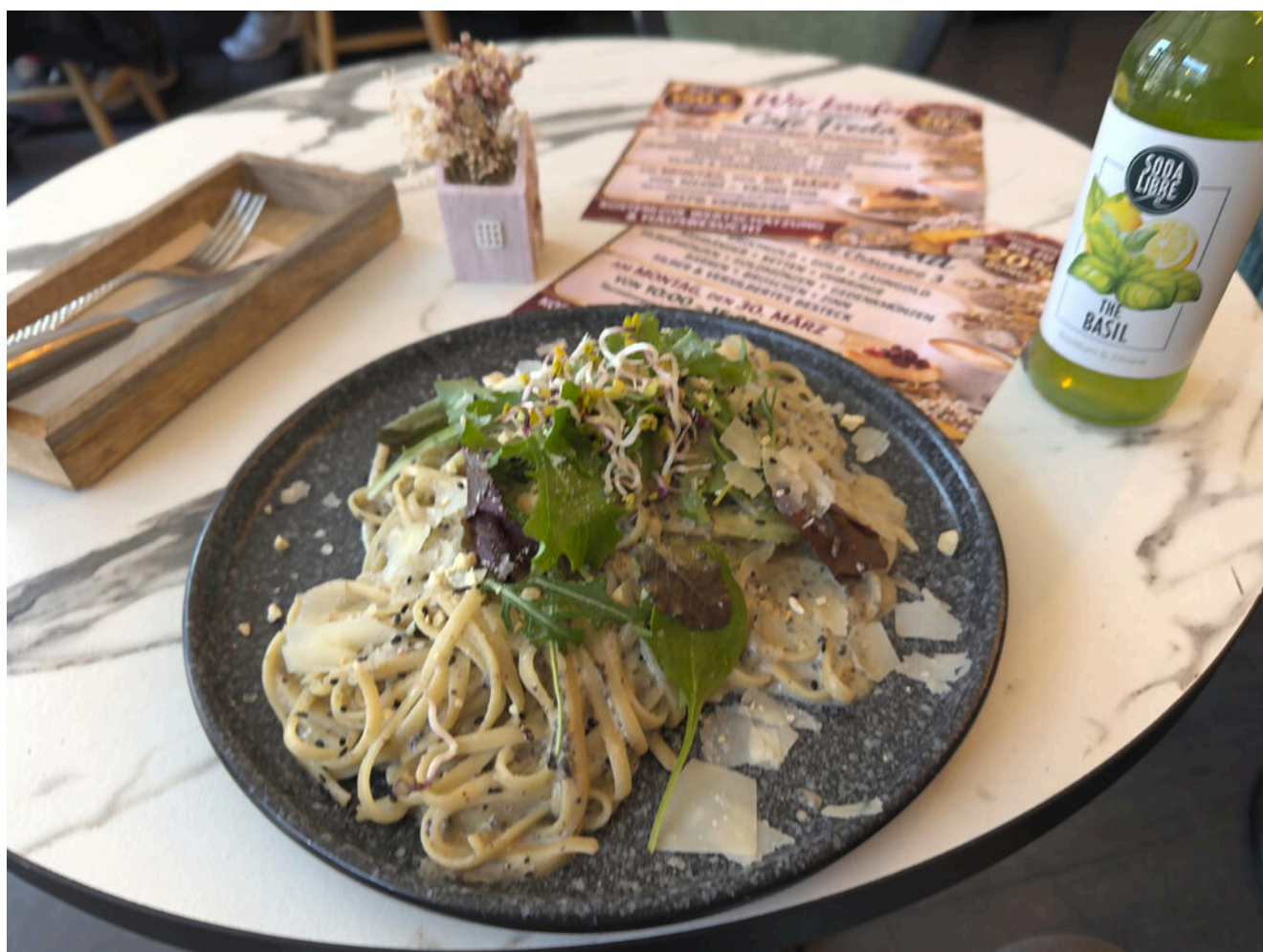
Leckeres Pastagericht im Café Freda