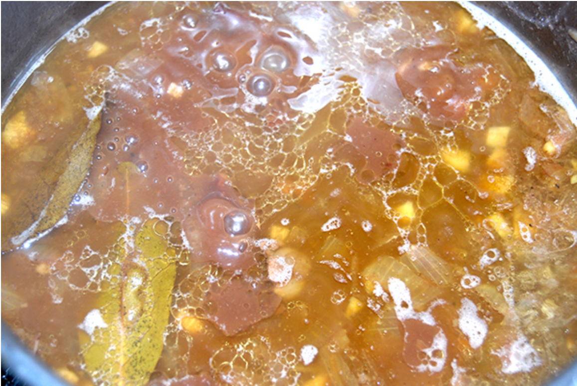
Schweineherz mit Gemüse in der reduzierten Sauce

ist. Es lässt sich somit hervorragend für ein Ragout verwenden.