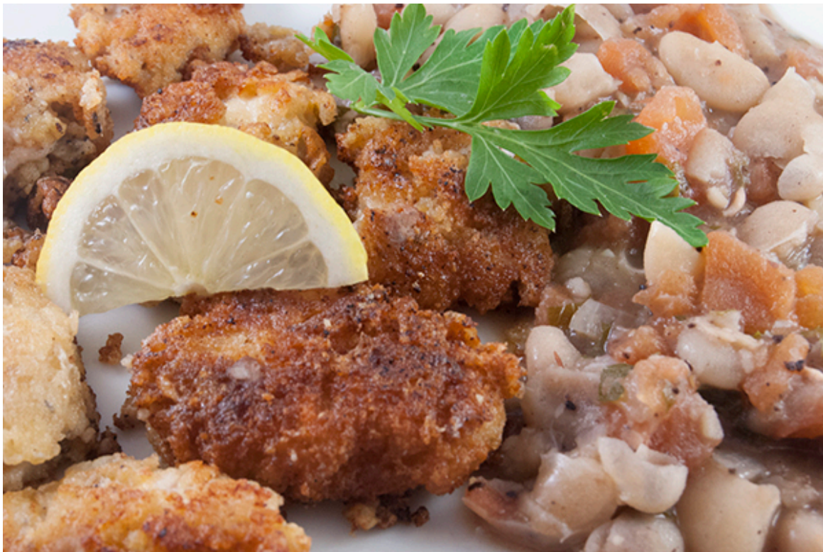
Paniertes Kalbshirn mit Gemüse

Vom frischen Kalbshirn vom Vortag hatte ich noch etwas übrig. Ich entschied mich für die panierte Variante, in Butter in der Pfanne gebraten. Dazu ein Gemüse, bei der die mehlig Konsistenz der weißen Bohnen ein klein wenig dem feinen Geschmack des Kalbshirns entspricht. Achtung, Kinder, die panierten Kalbshirnteile schmecken bis auf die etwas feinere Konsistenz ähnlich wie Chicken Nuggets. Also vor dem Essen immer erst Mama fragen, was sie Euch gerade aufischt. ;-)