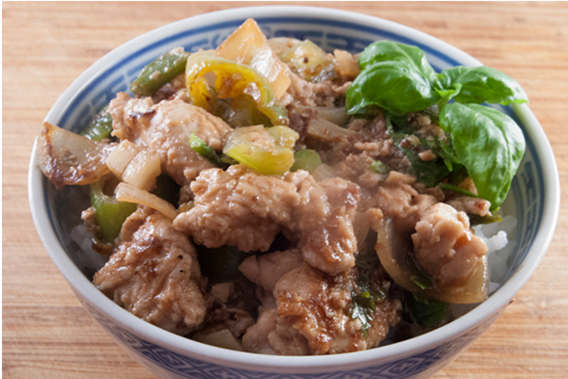
Gebratenes Kalbshirn mit Gemüse in asiatischer Sauce auf Reis

Der Rest des Kalbshirns erfährt eine etwas ungewohnte Zubereitung: asiatisch. Ich kam zu der Überlegung, dass zum Kalbshirn zwar keine dunkle Soja-Sauce passt, denn diese ist zu kräftig und schwer und passt nicht zur leichten Konsistenz des Kalbshirns. Aber eine leichte Teriyaki-Sauce und eventuell auch noch etwas leichte Austern-Sauce passen gut zum leichten Kalbshirn. Mariniert habe ich das Kalbshirn jedoch nicht, wie ich es bei Muskelfleisch des öfteren mache. Denn das Kalbshirn würde von seiner Struktur her zu viel von der Marinade „aufsaugen“.