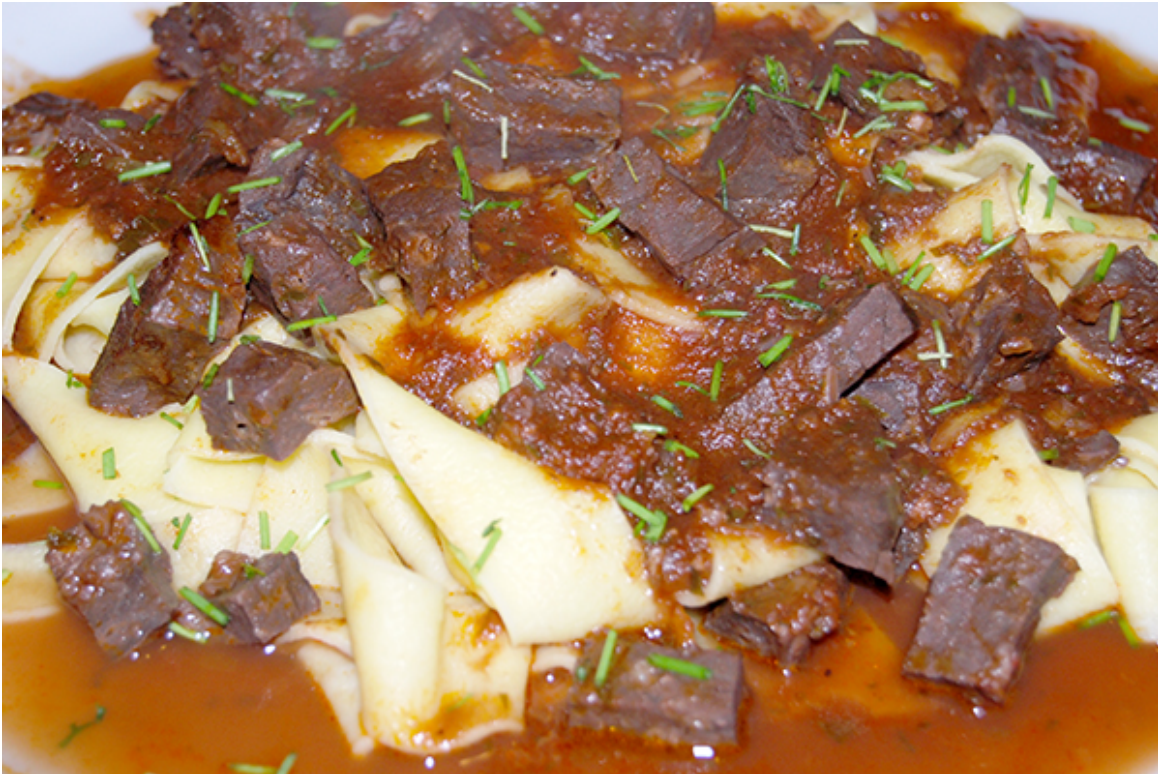
Kalbslungenragout in dunkler, roter Sauce auf frischer Papardelle

Bei meiner Recherche nach Rezepten für Kalbslungenragout fand ich im Internet und auch auf Foodblogs von Kollegen immer nur Rezepte mit einer weißen, saueren Weißwein-Sauce, aber nirgendwo ein Rezept mit einer dunklen, roten Sauce. Obwohl die Kalbslunge ein dunkelrotes Fleisch hat. Also entschied ich, die zweite Portion des Kalbslungenragouts mit einer solchen Sauce zuzubereiten und sie zu kreieren. Das Rezept ist für zwei Personen.