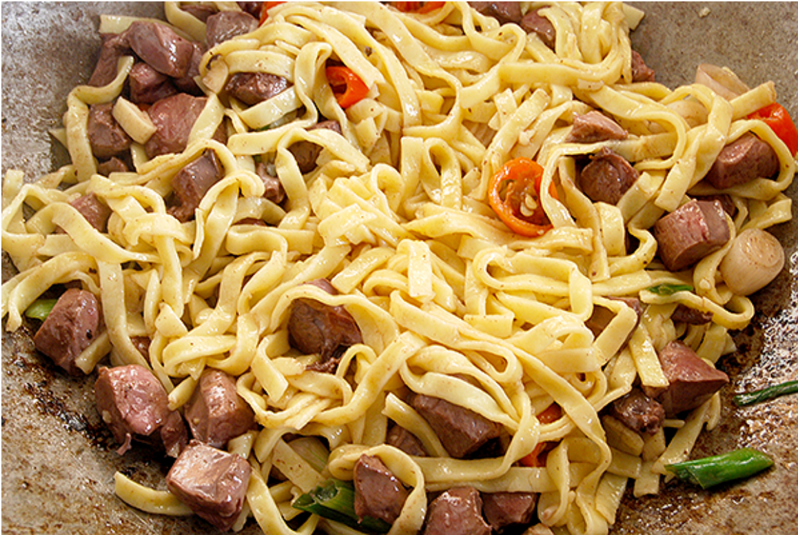
Herz, Gemüse und Nudeln im Wok

Sesamöl in einem Wok erhitzen. Herzwürfel und Gemüse einige Minuten darin anbraten und pfannenrühren. Die Nudeln dazugeben und auch einige Minuten bei Rühren anbraten. Die asiatischen Saucen und den Fond dazugeben. Alles ein wenig unter Rühren köcheln lassen. Mit Salz und Pfeffer abschmecken.