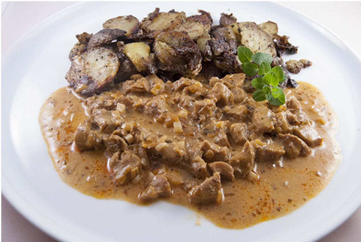
Hodenstücke in schmackhafter Sauce mit Bratkartoffeln

Männer, an den Herd oder den Grill! Es gibt Stierhoden! Zunächst die Euphemismen: Stierhoden sind die Hoden des männlichen Rindes. Sie sollen potenzfördernde Wirkung haben, da sie als Keimdrüsen nicht nur die Samenzellen produzieren, sondern auch das männliche Hormon Testosteron. Aber leider weit gefehlt mit der potenzsteigernden Wirkung, denn die geringe Menge an Testosteron in den Stierhoden wird beim Garen der Hoden verkocht. Nada, leider nichts mehr davon da!