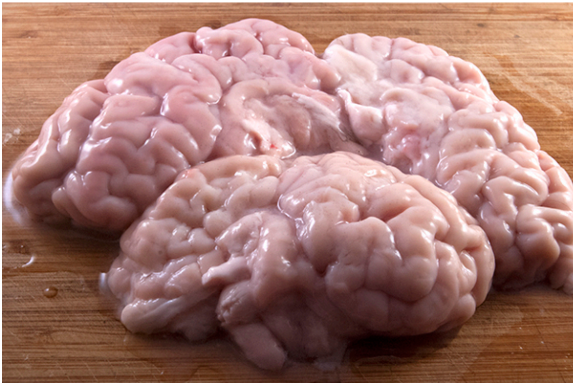
Rohes, gewässertes Kalbshirn

Zubereitungszeit: Vorbereitungszeit 2 Stdn. | Garzeit 20 Min.