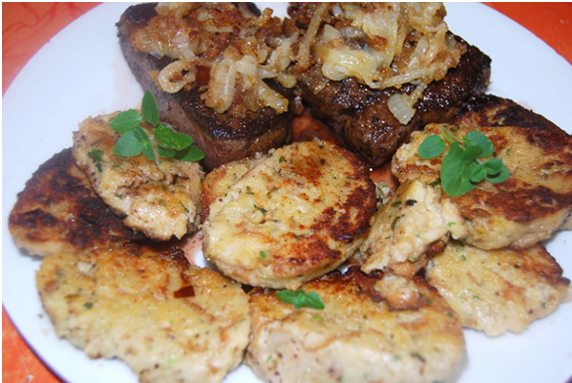
Leber mit Röstzwiebeln, Semmelknödelscheiben und Rotweinsößchen serviert

Als erstes bereitet man die Semmelknödel zu. Die Zutatenmenge in diesem Rezept ist natürlich viel zu hoch, aber die frische Semmelknödelzubereitung hat den Vorteil, dass man die Semmelknödel in Gefrierbeuteln einfrieren kann. Sie lassen sich einzeln entnehmen, dann sogar noch tiefgefroren in siedendes Wasser geben und nach 20–30 Minuten sind die Knödel aufgetaut, heiß und können serviert werden. Daher ergibt diese Zutatenmenge etwa 14–15 Knödel. Zwei werden für das Gericht benötigt, den Rest kann man für kommende Rezepte einfrieren. Wenn die Zutatenmenge dennoch zu hoch ist, dann eben nur 1/4 der Zutaten verwenden und 2–3 Semmelknödel zubereiten.