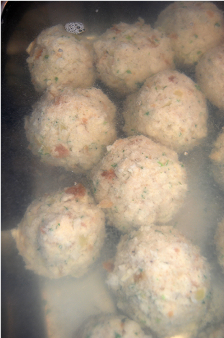
Semmelknödel im siedenden Wasser

Einen sehr großen Topf oder auch Bräter mit Wasser aufsetzen, das Wasser zum Kochen bringen und dann die Herdplatte ausschalten. Aus der Knödelmasse Knödel formen und mit einem Schaumlöffel vorsichtig in das nicht mehr kochende, sondern nur noch siedende Wasser legen. 20–30 Minuten ziehen lassen. Herausnehmen und abkühlen lassen. 2–3 Knödel für das Gericht zur Seite legen, die anderen wie erwähnt in 1–2 Gefrierbeuteln einfrieren.