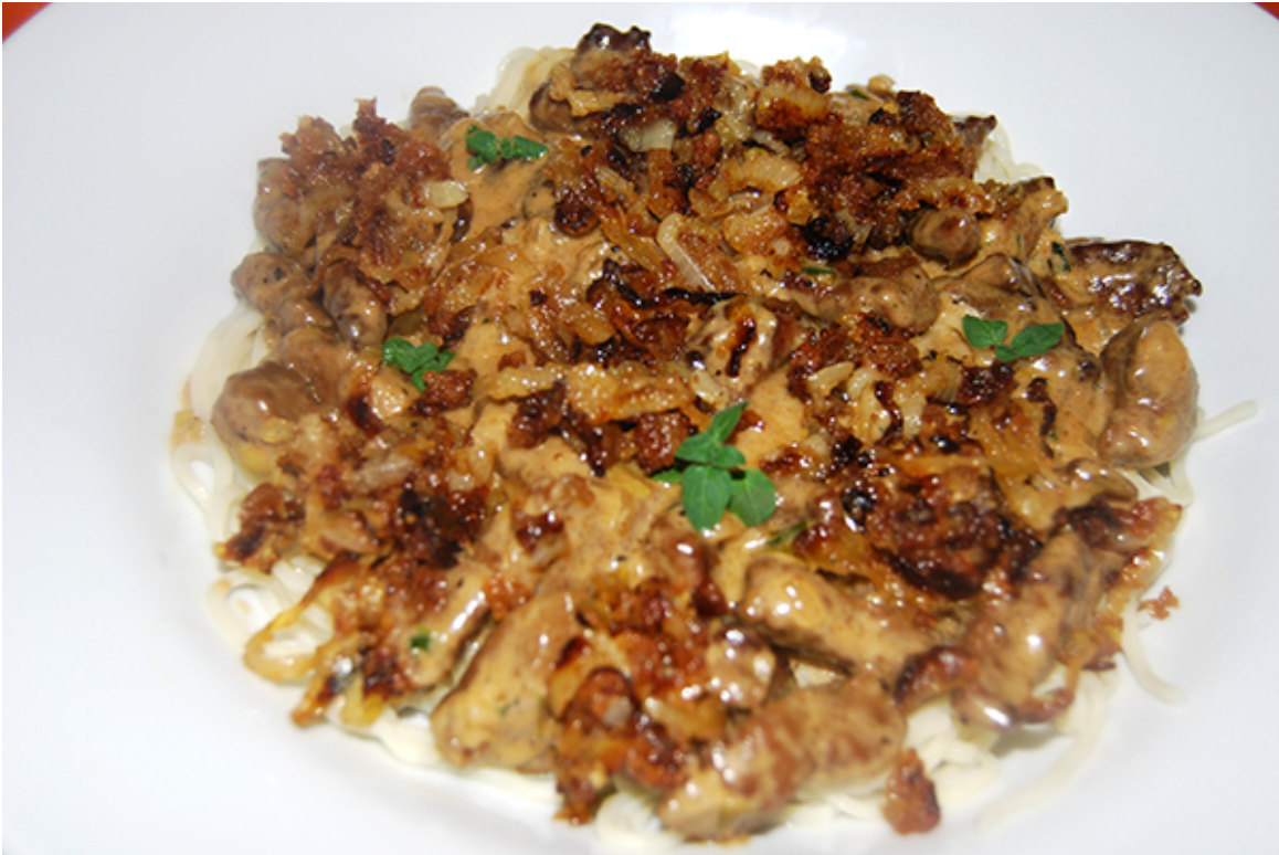
Lebergeschnetzeltes in Rahm-Sauce auf Chinanudeln, mit Röstzwiebeln garniert

Vom Vortag war noch Leber übrig. Diese lässt sich gut für eine Person als Geschnetzeltes zubereiten. Mit einer schönen Rahm-Sauce. Und chinesischen Nudeln. Die Rahm-Sauce auf alle Fälle als erstes zubereiten, denn sie wird am längsten brauchen. Das Lebergeschnetzelte darf nur kurz angebraten werden und dann in der fertigen Sauce kurz noch köcheln, sonst wird die Leber zu hart und trocken.