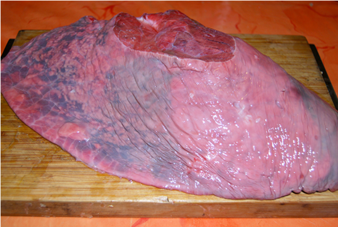
Ein frischer Kalbs-Lungenflügel

Waschen Sie die Kalbslunge unter fließendem Wasser. Schneiden Sie das Suppengemüse in kleine Stücke. Spicken Sie die beiden Zwiebeln mit den Nelken. Geben Sie alles in einen großen Topf und dann die Gewürze dazu. Füllen Sie alles mit 1–1,5 l Wasser auf, bis alles bedeckt ist.