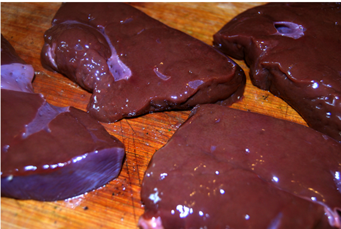
Leber in Scheiben