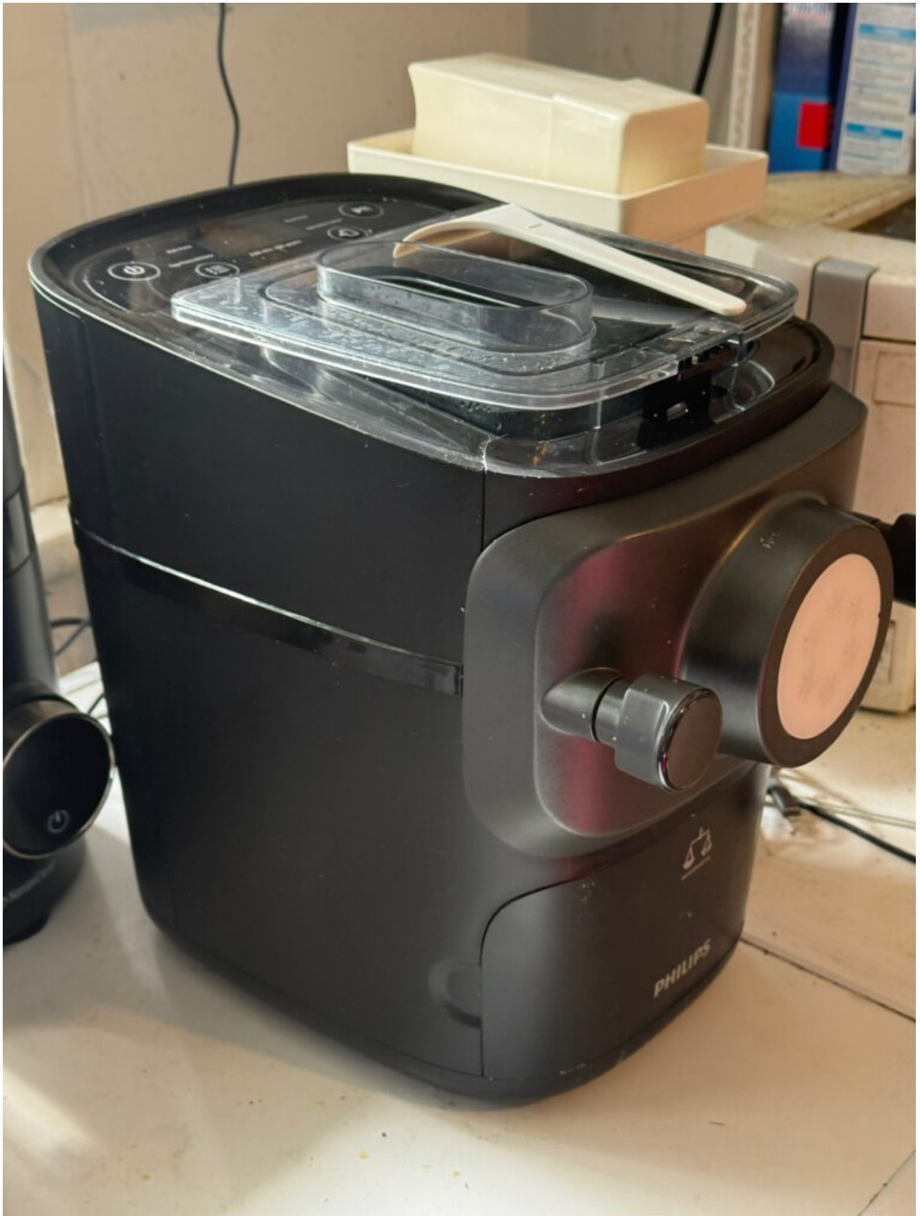
Der Spitzenreiter unter den Nudelmaschinen