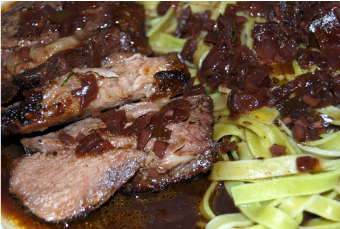
Lammkeule mit Fettuccine verde in dunkler Sauce

Lange geplant, jetzt endlich ausgeführt: Lammkeule mit der