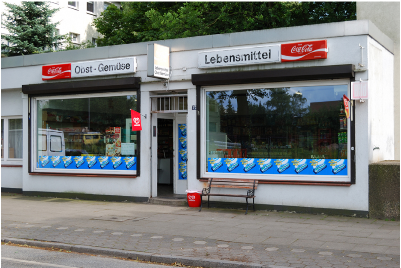
Außenansicht des Ladens in der Gustav-Adolf-Str. 27 in Wandsbek-Marienthal

hat. Die ganze Nachbarschaft trifft sich dort und fast jeder kennt fast jeden. Ich trinke dort abends nach der Arbeit mein Feierabendbierchen und klöne noch etwas.