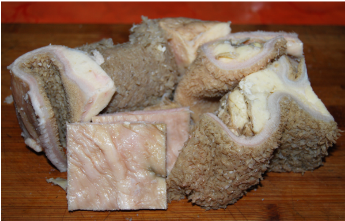
Gereinigter und aufgetauter Pansen vom Schlachter

Sie sollten den Pansen bereits gesäubert und gereinigt bei Ihrem Schlachter kaufen. Wenn Sie keinen gesäuberten Pansen bekommen können, muss er mehrmals gewässert, gebürstet und gekocht werden. Ich kann Sie übrigens insofern beruhigen, als dass die Zubereitung von schon gesäubertem und gereinigtem Pansen nicht mit einem starken, üblen Geruch verbunden ist, was von manchen Personen immer wieder angesprochen wird. Denn dann haben diese Personen Pansen nur als Futter für Hunde kennengelernt. Das kann durchaus stinken, weil er dafür eben nicht gesäubert werden muss.