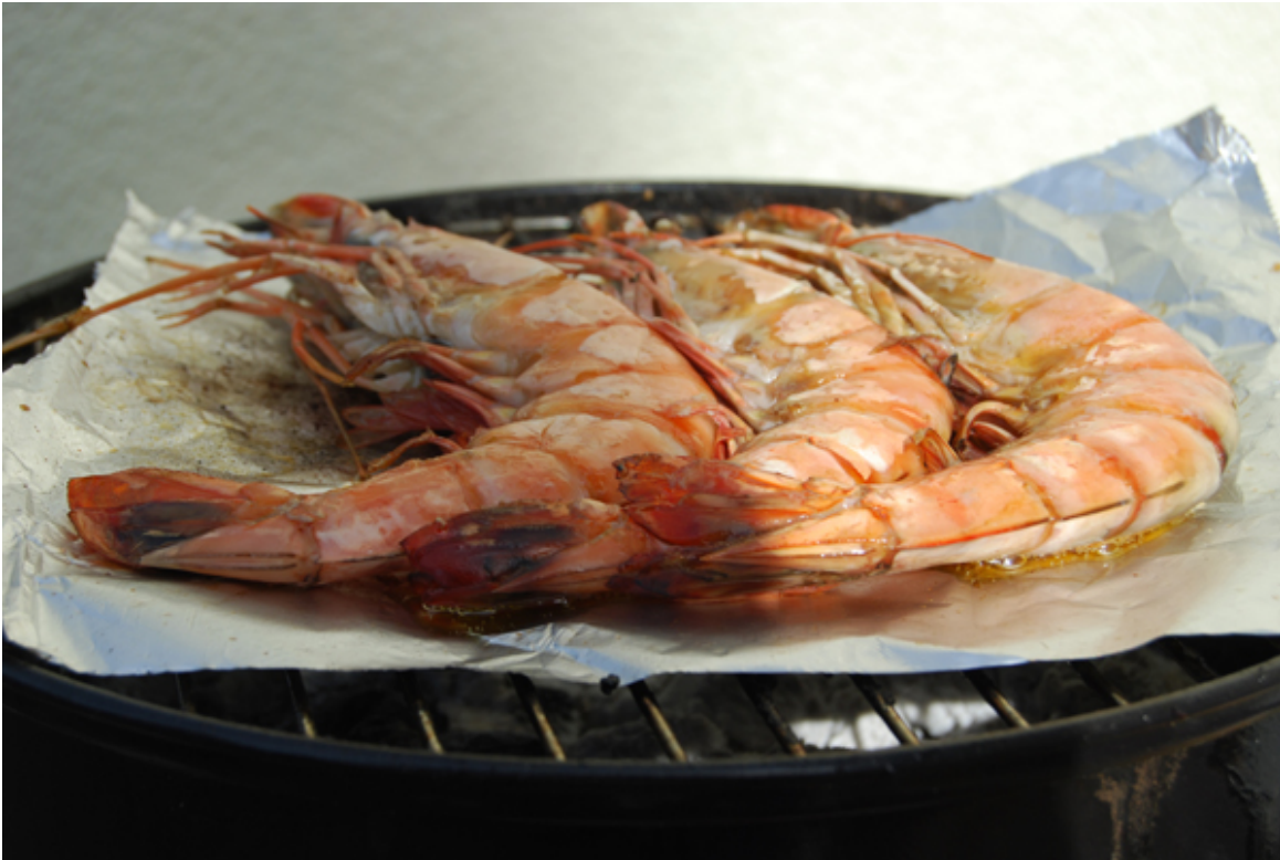
Gegrillte, rote Garnelen