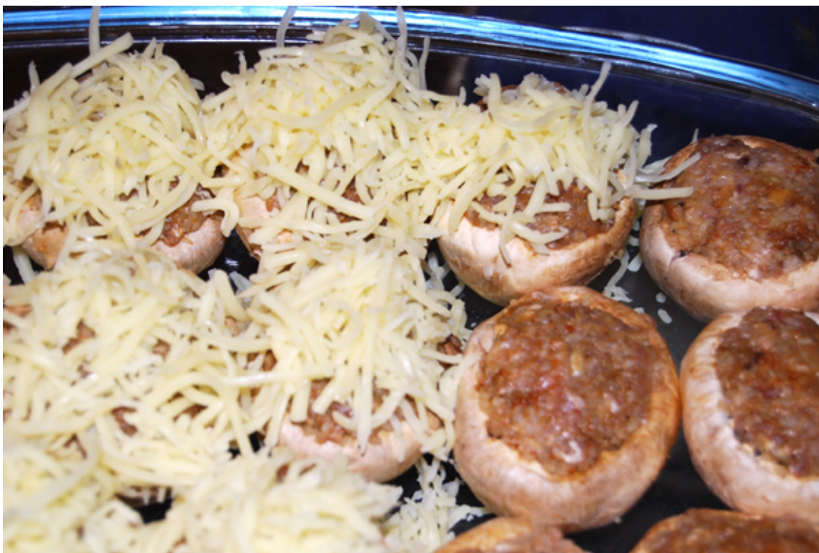
Die gefüllten und mit geriebenem Käse überstreuten Champignons in der Auflaufform

Dann teilen Sie die Mischung und geben sie in zwei kleine Schüsseln. Gemäß Gewürzmischung I und II würzen Sie die beiden Zutatenmischungen mit den unterschiedlichen Gewürzen.