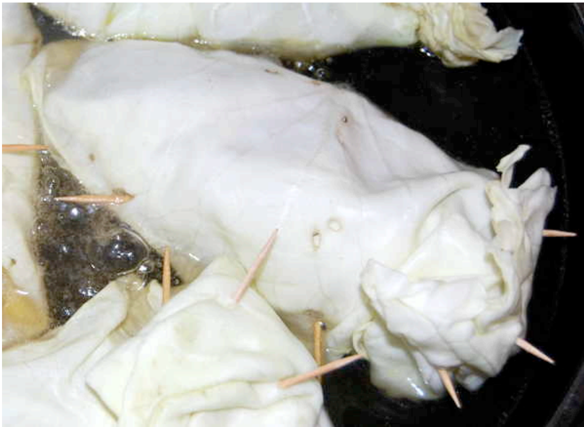
Gefüllte Weißkohlblätter in der Pfanne im Gemüsefond

Hackfleisch und das Gemüse. Außerdem gart in dieser Zeit der Bulgur/Couscous und zieht auch eine Menge Flüssigkeit aus der Brühe.