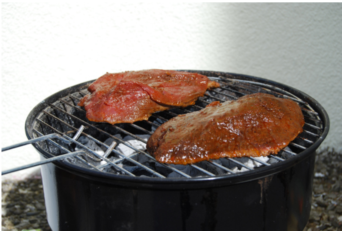
Mariniertes Fohlensteak (hinten) und Pferdesteak (vorne) auf dem Grill

Alles miteinander in einer kleinen Schüssel mischen und verrühren. Dann die Marinade in einen großen, etwas tiefen Teller geben und nacheinander die Steaks von beiden Seiten durchziehen und die Marinade darauf verteilen. Dann alle Steaks in einen Gefrierbeutel geben, die restliche Marinade dazu, dann verschließen und noch einmal durchkneten. Über Nacht im Kühlschrank marinieren lassen.