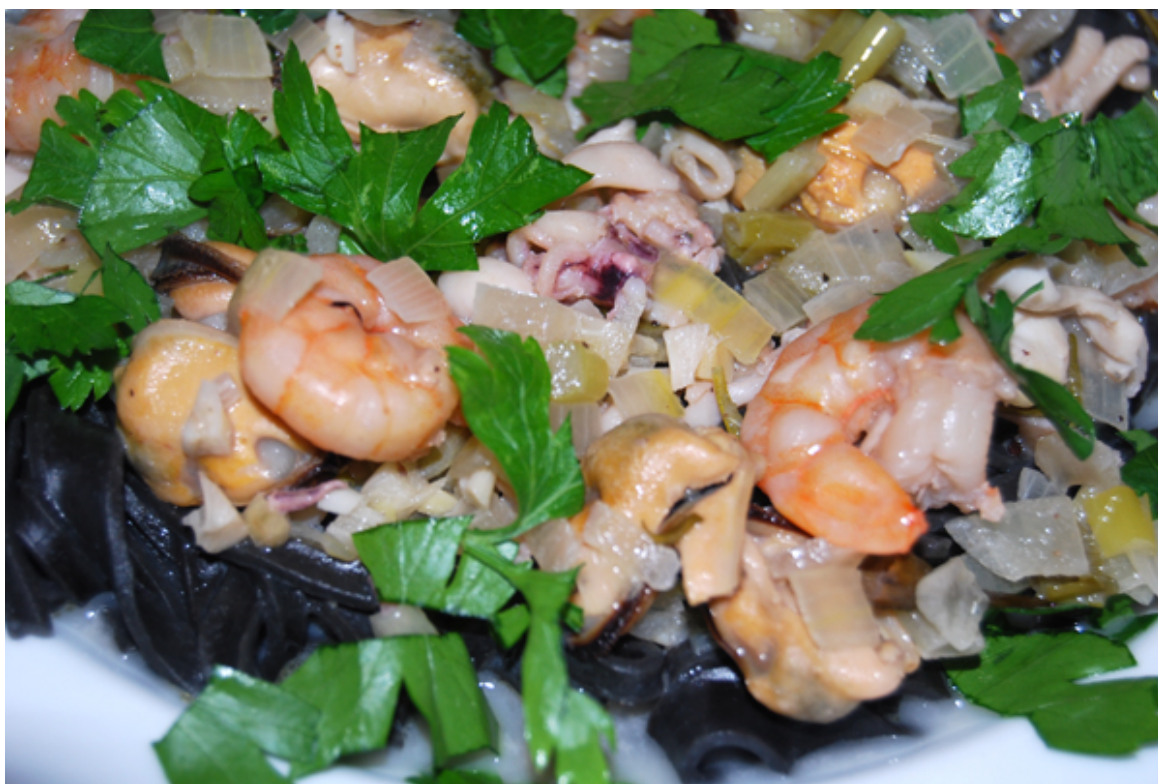
Tagliolini mit Meeresfrüchten – aufgenommen mit DSLR Nikon D40x

Frische Meeresfrüchte zu bekommen, ist manchmal schwierig. Gerade frische Muscheln, frische Tintenfische oder auch frische Garnelen sind schwierig zu bekommen, müssen manchmal Tage zuvor bei einer Frischfischtheke eines Discounters bestellt werden und kosten dann entsprechend auch sehr viel. Aus diesem Grund können Sie für dieses Gericht einfach eine Tiefkühlpackung Meeresfrüchte verwenden, die leicht zu bekommen und preiswert ist und womit das Gericht dennoch sehr gut gelingt.