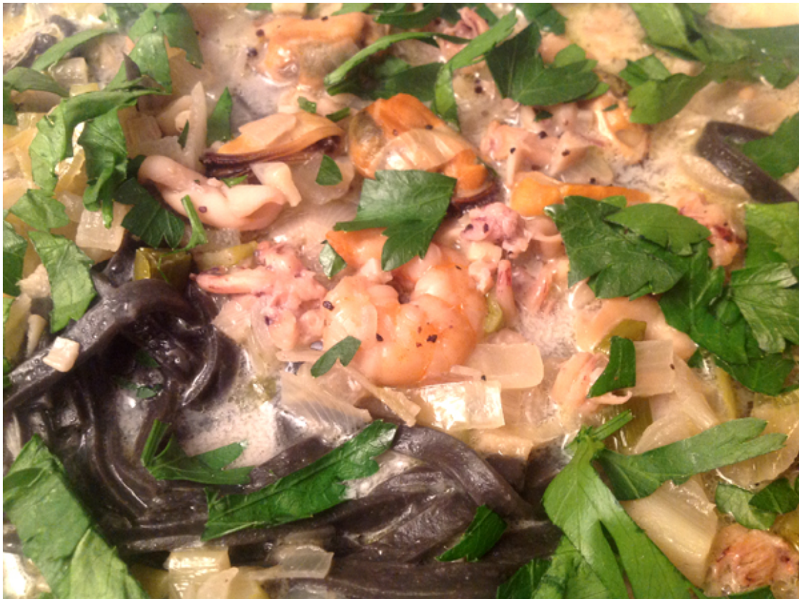
Tagliolini mit Meeresfrüchten – aufgenommen mit iPad3

Diesmal habe ich mich für schwarze Pasta entschieden – schwarz, weil sie mit Tintenfischfarbe produziert wird. Sie riecht auch leicht nach Fisch und Meeresfrüchten, so dass sie auch nur damit serviert werden sollte. Das Rezept ist für zwei Personen.