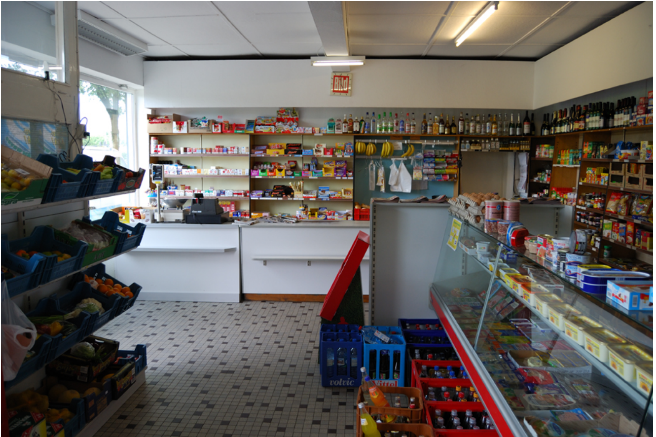
Innenansicht auf die Theke des Ladens

Aber manchmal reagiert er auch auf die Wünsche seiner Kundschaft und bringt von seinen Lieferanten neue, attraktive und für seinen kleinen Lebensmittelladen fast schon ausgefallene Artikel mit. Das sind frische, thailändische Chilischoten für die „scharfen“ Kunden. Und natürlich Saisonware wie Spargel im Frühsommer, Obst und Pfifferlinge im Sommer und auch Knoblauchzöpfe mit 10–12 Knoblauchknollen, wahlweise aus Frankreich oder China.