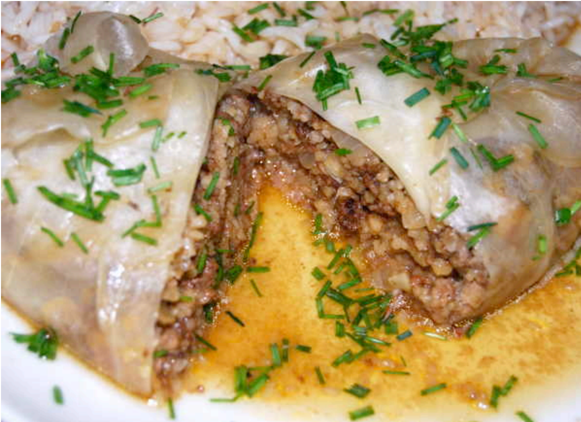
Angerichtete Weißkohlblätter, gefüllt mit Hackfleisch und Bulgur, auf Reis

Nun habe ich mich endlich einem großen Weißkohl gewidmet, der schon einige Wochen im Kühlschrank vor sich hindümpelte. Weisskohlköpfe können so etwas ab und sind hart im Nehmen. Ich habe die äußersten, leicht trockenen Blätter entfernt und dann vier große, frische und knackige Blätter für die gefüllten Weißkohlblätter gewählt. Das Rezept ist für zwei Personen.