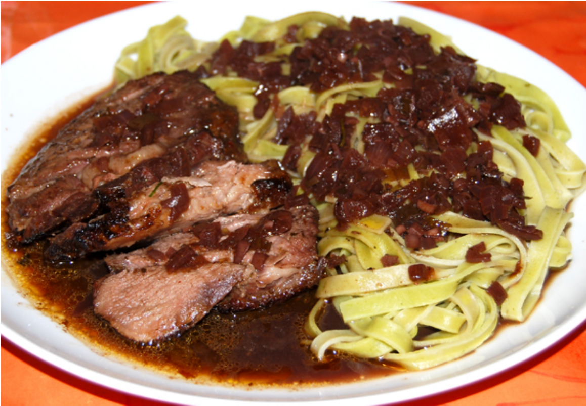
Angerichtete Lammkeule mit Pasta und dunkler Sauce