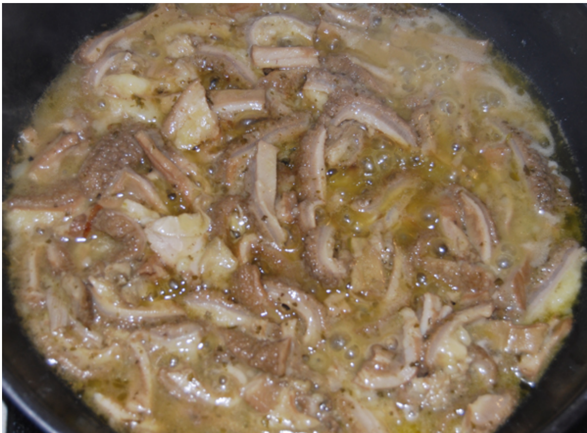
Angebratener Pansen in der Pfanne

erhitzen Sie diese und geben Sie die Pansenstreifen hinzu. Lassen Sie die Pansenstreifen gut anbraten, bis sie kross und braun sind. Dies kann durchaus 15–20 Min. dauern. Nun salzen und großzügig mit frischem, gemahlenem Pfeffer würzen. Die angebratenen Pansenstreifen haben den Geruch von normalem Rinderfleisch – kein Wunder, denn der Pansen ist ja auch Muskelfleisch, wie der Magen von allen Säugetieren. Er zieht jedoch beim Anbraten etwas Flüssigkeit und geliert ein wenig. Lassen Sie deswegen alle entstehende Flüssigkeit erst verdampfen, damit der Pansen schön angebraten wird. Der Pansen wird in der Pfanne sicherlich leicht anbrennen, so dass Sie ihn immer mit einem Pfannenschaber vom Pfannenboden lösen müssen. Stören Sie sich nicht daran, denn mit dem Weißweinessig und Weißwein zum Ablöschen und den in der Pfanne verbliebenen Röststoffe erstellen Sie zuletzt eine gebundene Sauce für das Gericht.