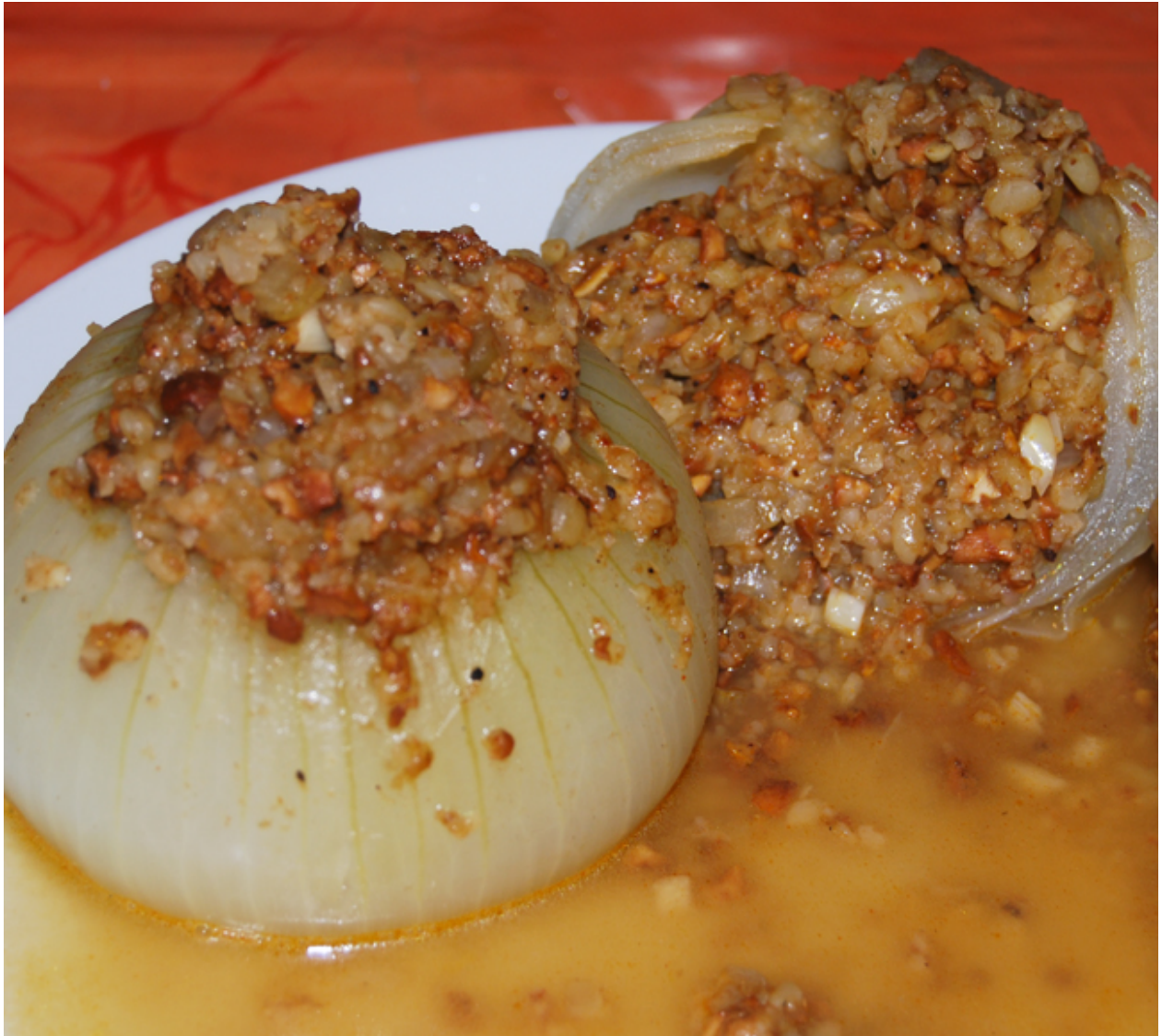
Gefüllte Gemüsezwiebeln vegetarisch

Gute Nachricht für die „Gemüseguerilla“: Das gepostete Rezept für gefüllte Gemüsezwiebeln geht natürlich nicht nur mit Rinderhackfleisch, sondern auch komplett vegetarisch, vorzugsweise mit Bulgur. Das Rezept ist für zwei große Gemüsezwiebeln für eine Person.