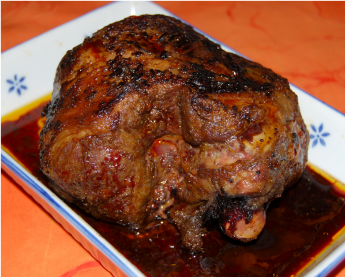
Gegarte Lammkeule direkt aus dem Backofen

Etwa eine Stunde vor Ende der Garzeit der Lammkeule können Sie die Sauce zubereiten. Für die Sauce habe ich mal ganz tief in meine Trickkiste gegriffen. Ich dachte mir, zu solch einem dunklen, kräftigen, aber dennoch butterweichen, zarten Fleisch gehören viele dunkle Zutaten. Es bietet sich natürlich an, für die Sauce gleich rote Zwiebeln zu verwenden, diese hatte ich aber nicht mehr vorrätig. Dann passten natürlich Rotwein, dunkle Sojasauce, dunkle Worcestershire-Sauce und fast schwarze Chilipaste dazu. Zurückgehalten habe ich mich dann mit frischem Ingwer, der meiner Ansicht nach der Sauce eine zu deutliche Ausrichtung gegeben hätte. Auch den Crema di Balsamico rosso habe ich weggelassen, denn die Worcestershire-Sauce bringt schon genügend Säure mit sich.