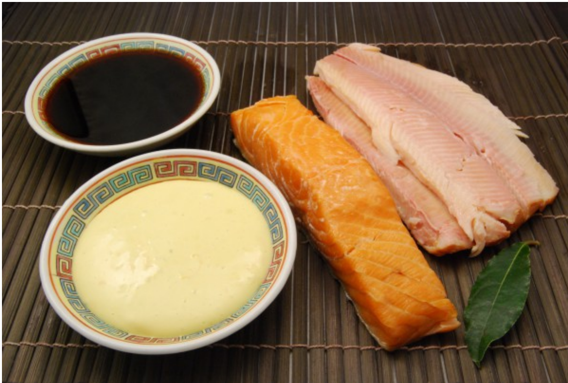
Lachs und Forelle mit Dips

Eigentlich wollte ich schönes Sashimi mit zwei Dips zubereiten. Dann stellte ich jedoch fest, dass ich in der Eile des Einkaufs im Kühlregal nicht nach frischem Lachsfilet, sondern geräuchertem Stremel-Lachs gegriffen hatte. Der geräucherte Lachs hat eine ebenso helle, rote Farbe wie der frische, und so war der Unterschied beim Einkauf nicht zu erkennen.