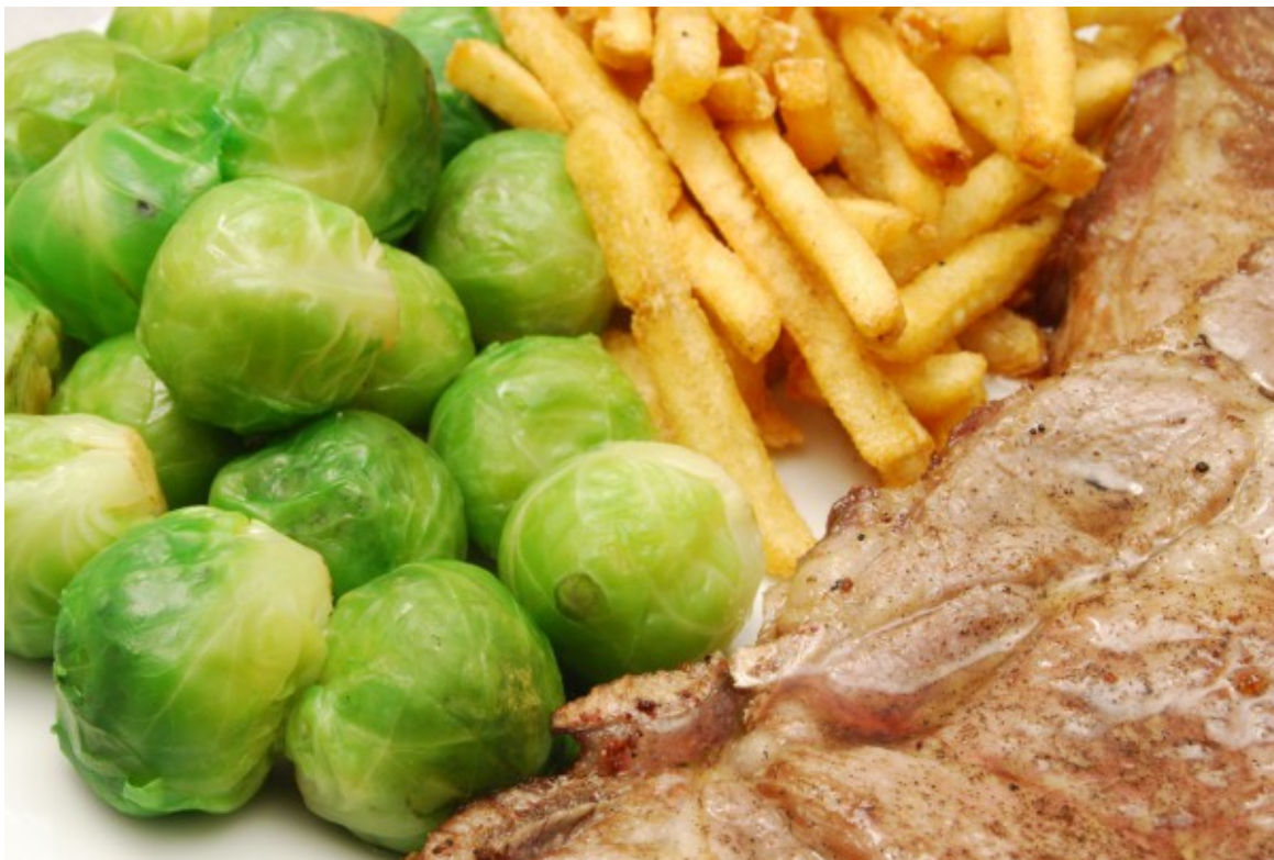
Koteletts, Pommes und Gemüse

Jetzt hätte ich doch beinahe einen „Frittierten Teller“ zubereitet, denn ich überlegte, ob ich zusätzlich zu den Koteletts und den Pommes frites auch noch die Rosenkohlröschen frittiere. Das war mir dann aber doch zu viel des Guten. Ich habe sie wie gewohnt in kochendem Wasser gegart und etwas gesalzen.