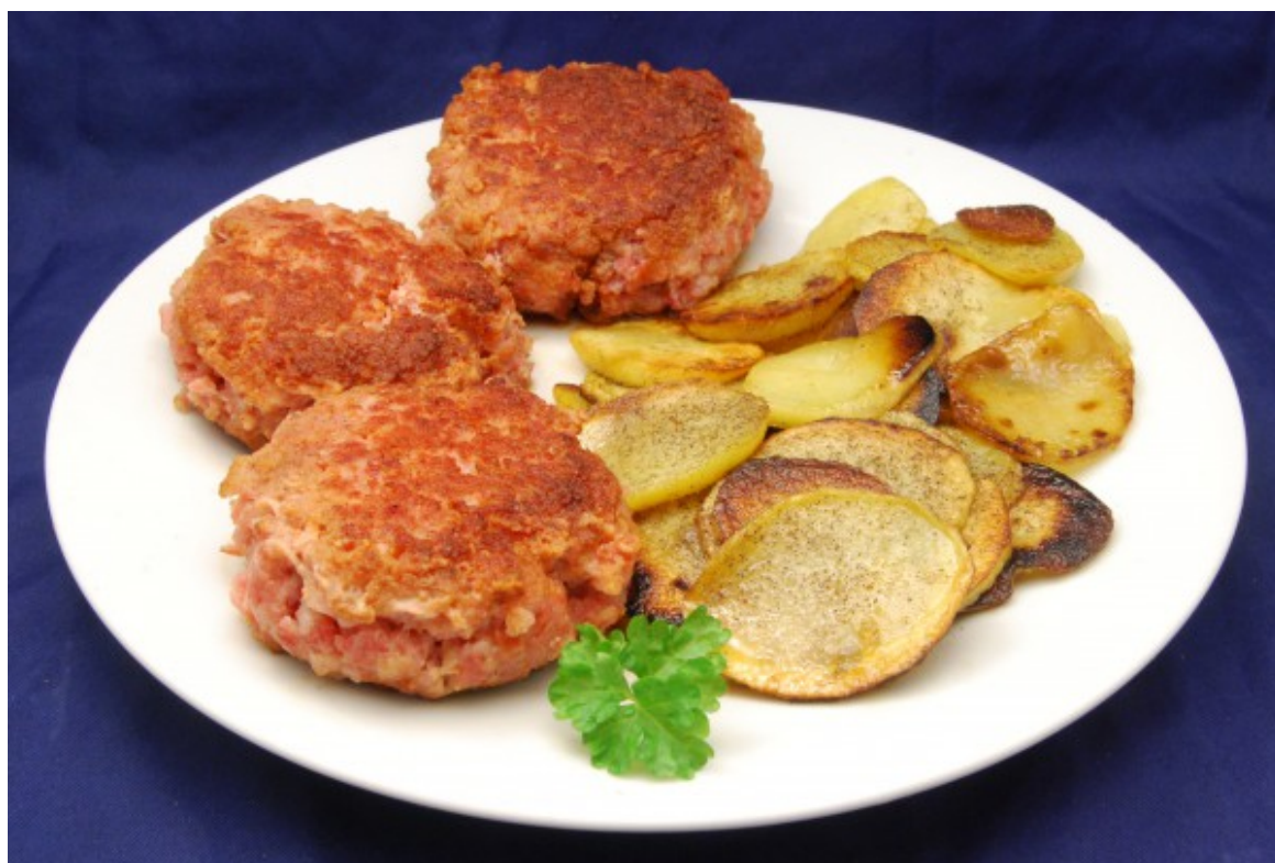
Frikadellen mit Kartoffeln

Ich wollte auch noch die restlichen, eingefrorenen 600 g Speckstreifen verarbeiten und habe sie einfach zu einer Art Hackfleisch durch den Fleischwolf gedreht. Dazu nur ein Ei, der Speck hat, durch den Fleischwolf gedreht, genug Bindung. Und würzen braucht man ihn ja nicht.