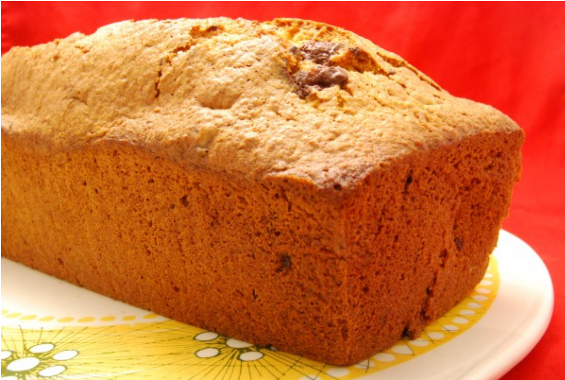
Fertig gebackener Karottenkuchen

Dann Backform herausnehmen, Kuchen aus der Backform lösen, auf ein Kuchengitter geben und gut abkühlen lassen. Nach einem Tag Ruhezeit schmeckt der Kuchen noch aromatischer.