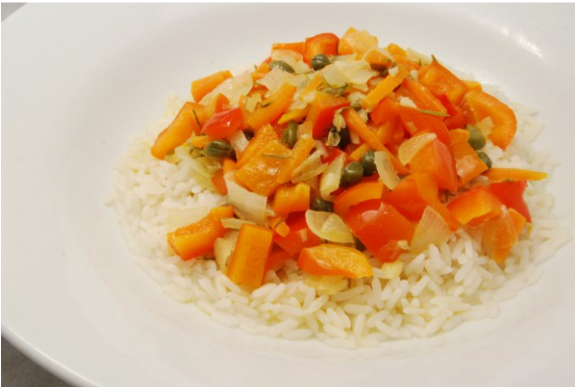
Gemüse mit Rosmarin und Kapern und Reis

Diesmal ein veganes Gericht. Dafür habe ich dann sogar die Butter weggelassen und Margarine verwendet. Denn ursprünglich wollte ich eine Butter-Sauce mit Rosmarin und Kapern